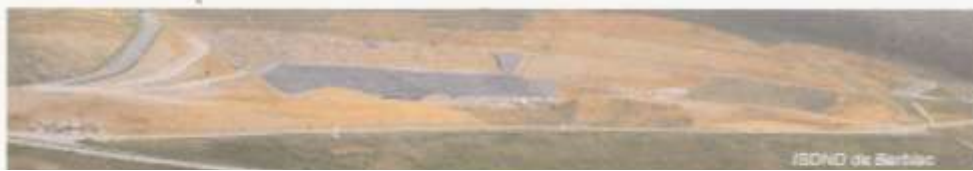
ISND de Berbiac